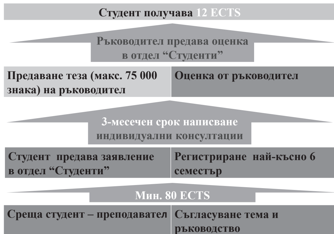
Фиг. 1. Процедура за бакалавърска теза (Университет Пасау)

Fig. 1. Procedure of Bachelor Thesis (University Passau)