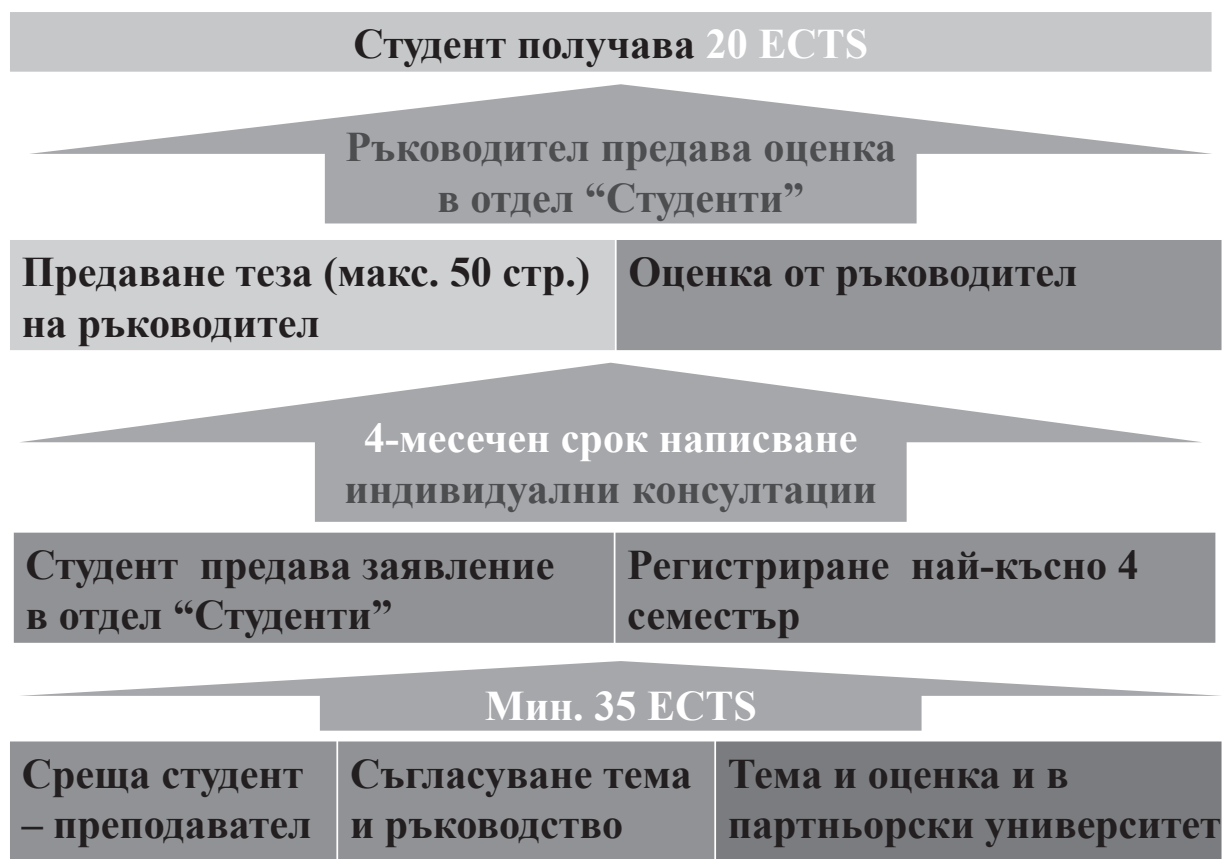
Фиг. 3. Процедура за магистърска теза (Университет Пасау)

Изключително и само с теза. Защитена теза дава 20 ECTS. За да бъде придобита магистърска степен в тази специалност, студентът е необходимо да събере минимум 120 ECTS, които се разпределят: 55 ECTS от задължителна програма; 65 ECTS от задължително избираема програма.